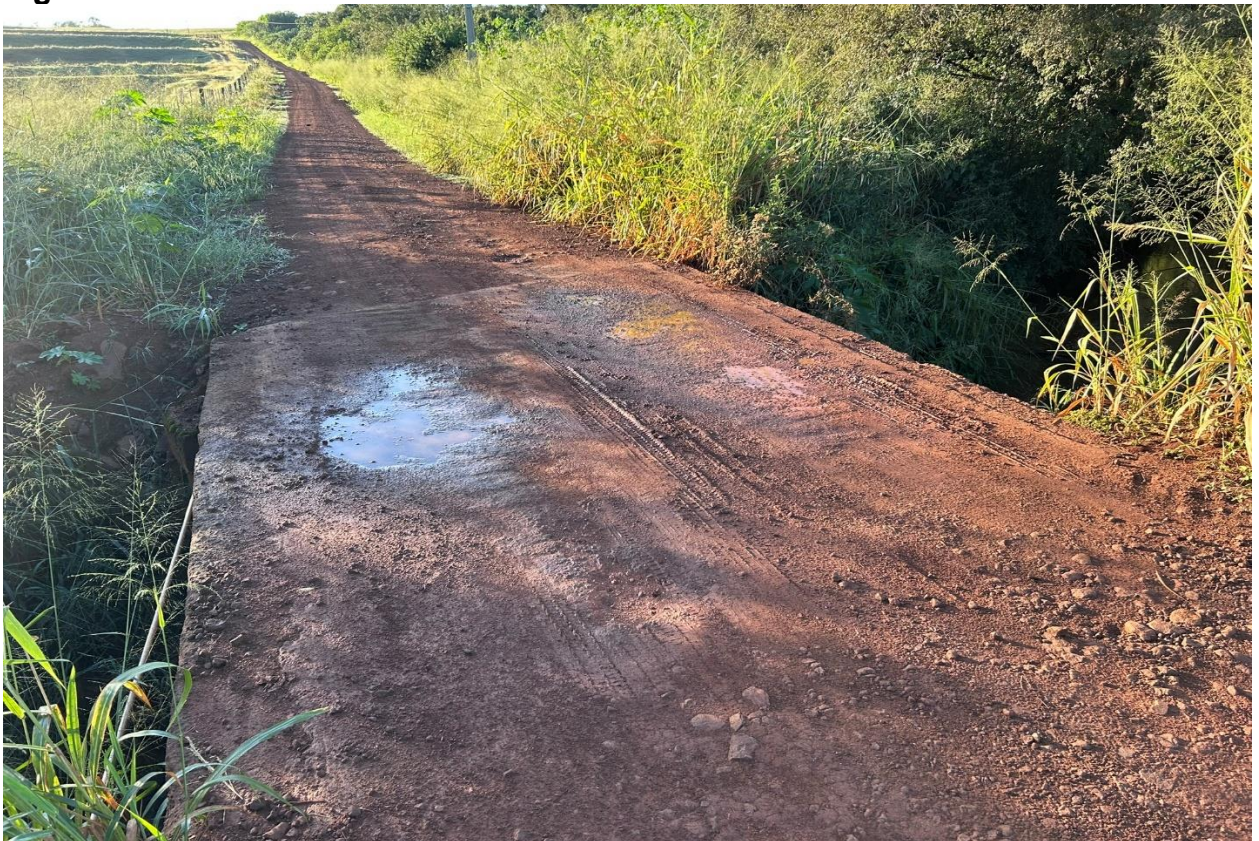
Figura 2 – Ponte sobre o Rio do Ouro.